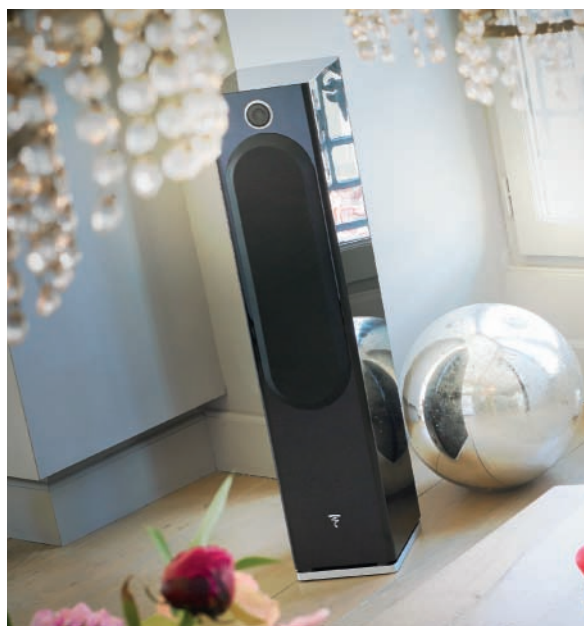
Diffusore Easya, finitura Black High Gloss

Naturalmente questi pratici vantaggi sono accompagnati dal suono 100% Focal: diffusori amplificati da pavimento a due vie e 1/2 bass-reflex, amplificatore integrato da 85W RMS, stessi altoparlanti della famosa serie Chorus (c o n o in Polyglass da 13cm ), nuovo tweeter TNV2 in alluminio/magnesio a cupola inversa con sospensione in Poron, etc... ancora una volta, rinnovata tecnologia al servizio della qualità e della fedele riproduzione del suono.